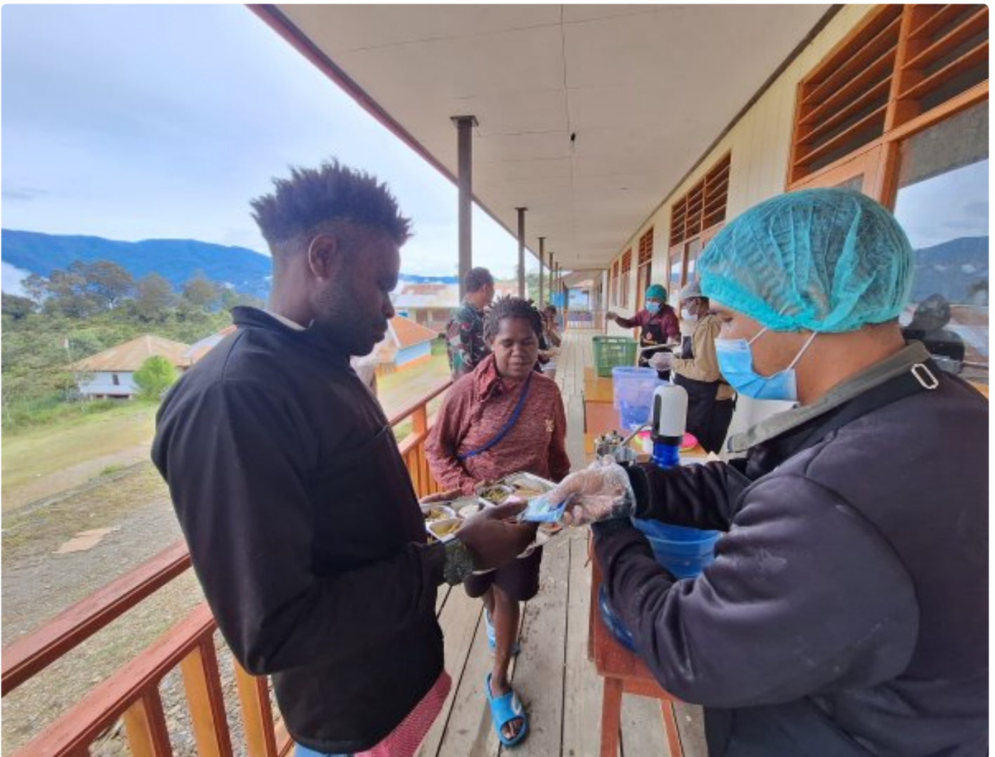
Program Makanan Bergizi Gratis (MBG) yang digagas Satgas Yonif 509 Kostrad bersama Satgas TNI lainnya di Intan Jaya, Papua, Jumat 15 Februari 2025.