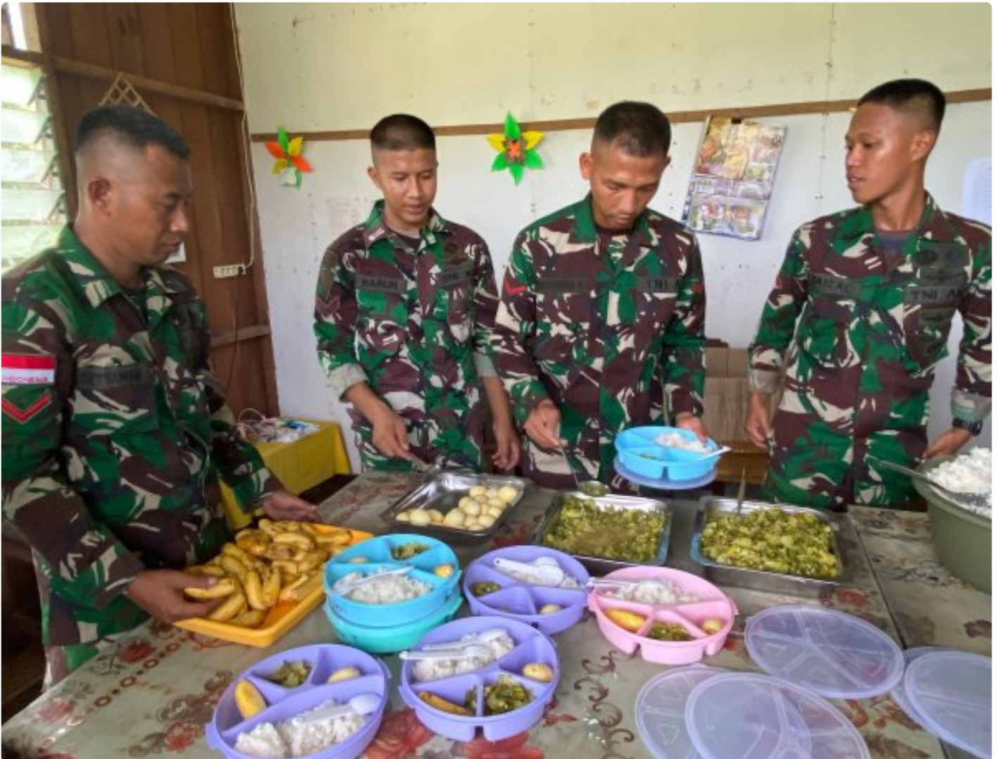
Foto: Dedikasi Satgas Pamtas Mobile RI-PNG Yonif 503/Mayangkara dalam mendukung program makan bergizi gratis pemerintah mendapat apresiasi tinggi dari masyarakat Distrik Krepkuri, Kabupaten Nduga, Papua, di sekolah rimba, Rabu (29/01/2025).

NDUGA- Dedikasi Satgas Pamtas Mobile RI-PNG Yonif 503/Mayangkara dalam