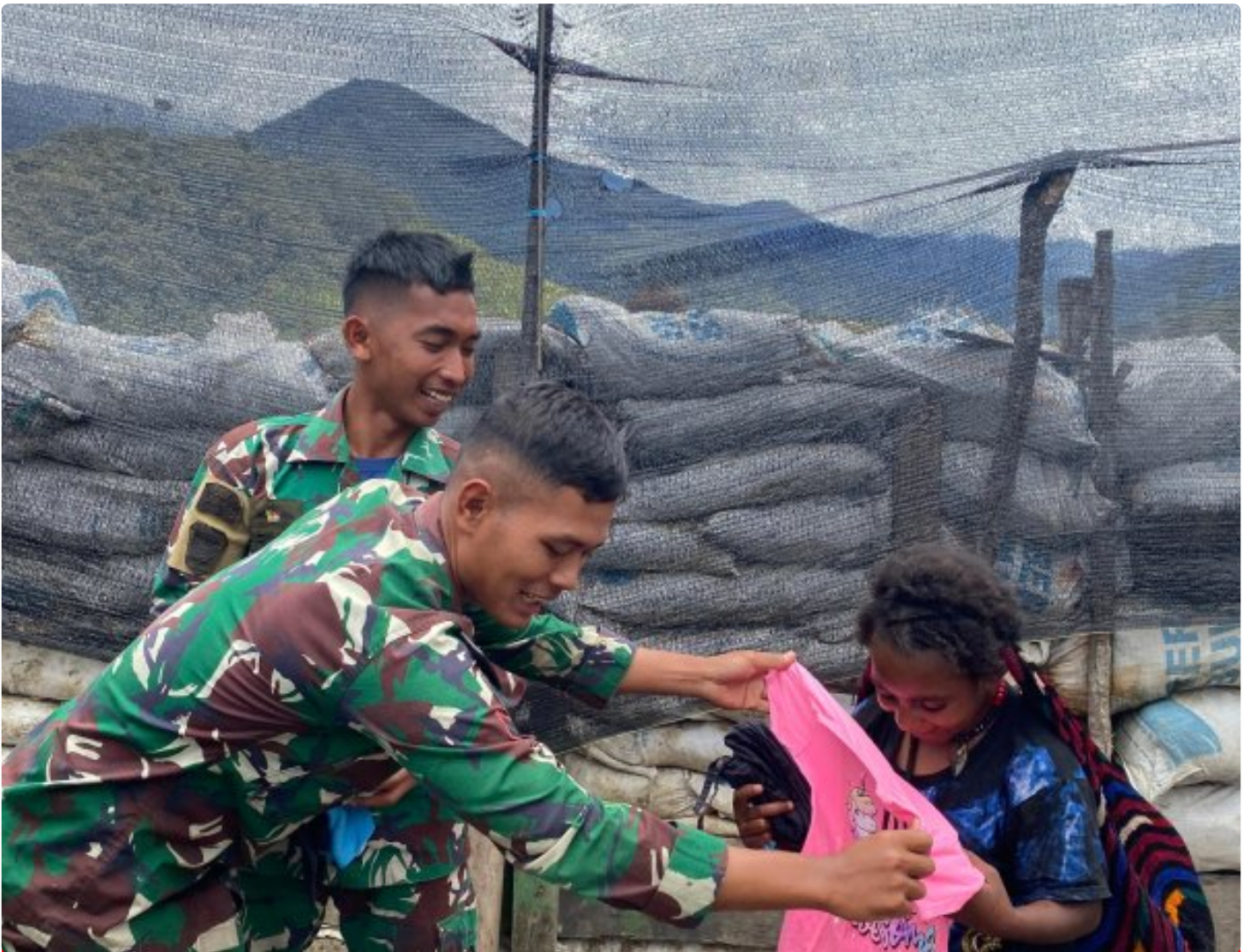
Satgas Yonif 323 Buaya Putih Bagikan Pakaian kepada masyarakat sekitar Titik Kuat

Satgas Yonif 323 Buaya Putih Kostrad kembali menunjukkan kepeduliannya kepada masyarakat sekitar dengan membagikan pakaian layak pakai di sekitar titik kuat operasi, Aksi ini merupakan bagian dari program kemanusiaan yang dilakukan oleh Satgas dalam rangka mempererat hubungan antara TNI dan