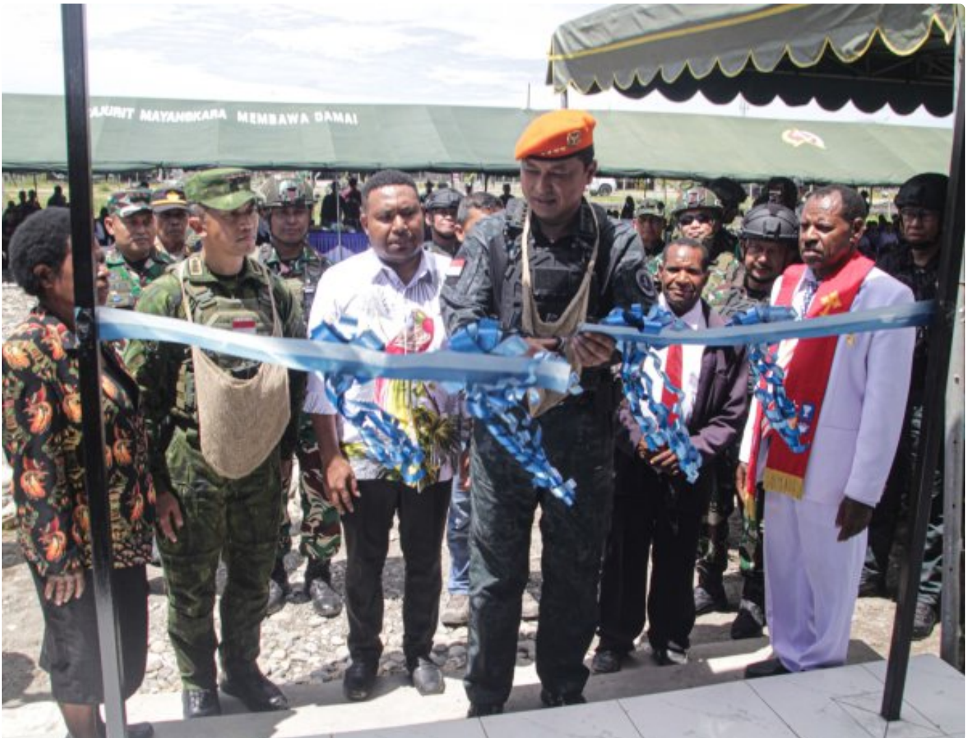
Foto: Kepala Staf Angkatan Udara (Kasau), Marsekal TNI Mohamad Tonny Harjono, S.E., M.M., meresmikan Gereja GPDI Mayangkara pada Rabu (12/02/2025).

NDUGA- Sebuah momen bersejarah terjadi di Kabupaten Nduga, Papua, ketika Kepala Staf Angkatan Udara (Kasau), Marsekal TNI Mohamad Tonny Harjono, S.E., M.M., meresmikan Gereja GPDI Mayangkara